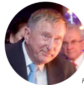
Enn Meri

sustas määrata Enn Meri Riigikogu rahanduskomisjoni liikmeks. Samuti tegi fraktsioon Riigikogu juhatausele ettepaneku määrata Meri Riigieelarve kontrolli erikomisjoni liikmeks.