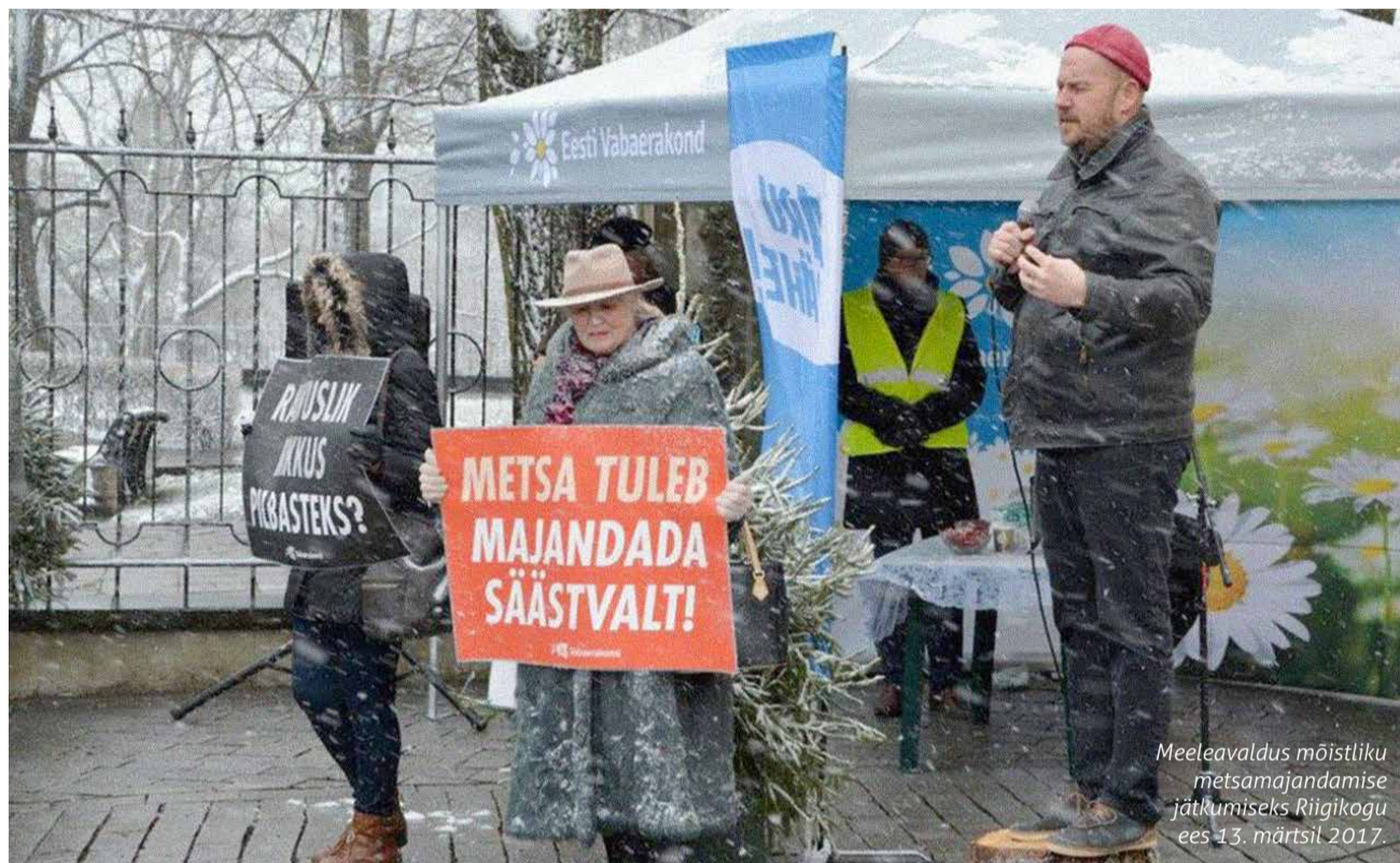
Meeleavaldus mõistliku metsamajandamise jätkumiseks Riigikogu ees 13. märtsil 2017.